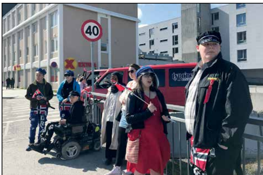
Mens vi venter på toget på 17.mai.