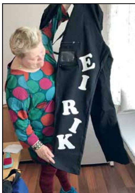
Russeklær må strykes og ordnes klare til russetida starter.