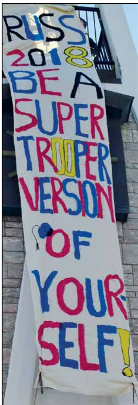
Banneret vi hengte opp i kirketårnet dagen før 1.mai

allerede...» det ble startpunktet for tanken om at neste år skal vi være russ - KIRKERUSS. Så var vi i gang, som russ flest: Vi trenger penger! Skal man være russ, trenger man penger til klær og til fest, så vi måtte samle inn penger. Før jul gikk vi i gang med å produsere varer slik at vi kunne selge på julemarkedet på Gjenreisningsmuseet. Siden gikk det slag i slag. Klær ble bestilt, og russekort. Mange russekort. Den 30.april var vi klar. For rusседåp og russetid.