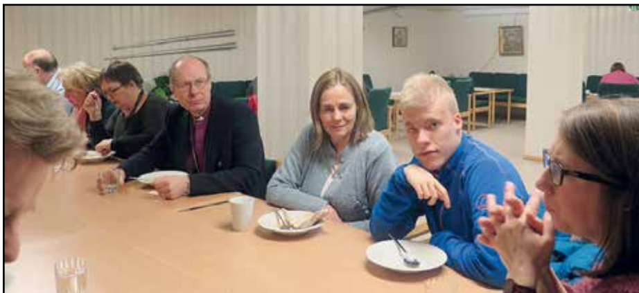
Hyggelig middagsstund og deilig suppe for Knottesangen.