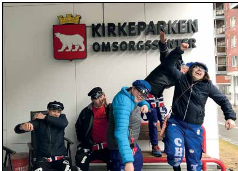
Kirkeruss ved Kirkeparkjen