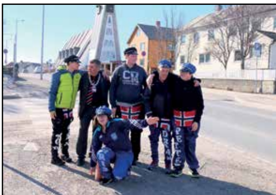
Russ og ordfører